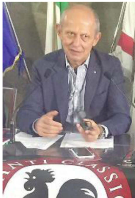
L'assessore regionale Ciuoffo

tiva». Questo è stato oggetto di incontri con l'amministrazione comunale che a più riprese ha ricevuto i genitori dei bambini dei nidi e delle materne, finché si optò per la rescissione del contratto con Ladisa, annunciando il ritorno al gestore Elior, mantenendo invariate le tariffe e offrendo la garanzia che in cucina e a mensa ci sarebbero rimaste le stesse persone.